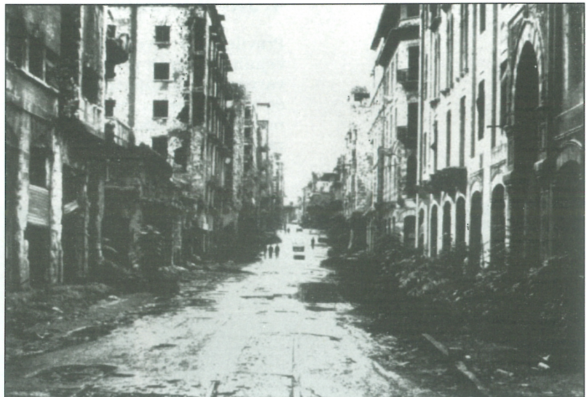
Slika 2: Razdejana ulica

To napetost, to kvaliteto, to tako imenovano 'prvost' v fenomenologiji Pierca lahko imenujemo odmev. Pojavi se, ko prenaša valovno dolžino, ki resonira s subjektivnostjo, v smislu vseh subjektov. V študiji o bejrutski Green-Line , je ta energija poimenovana kot ikonično mesto – Iconicity .