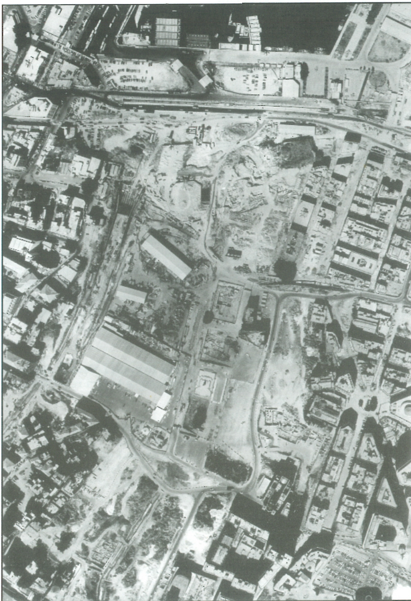
Slika 1: Zračni posnetek središča Bejruta

Med predavanjem Ovoj, oblika in spremembe, v Ljublani, je dr. Moystad izpostavil dejstvo, da so mestne ulice nevarni prostori v vojnih razmerah; tako je bilo v Bejrutu, tako je bilo v Sarajevu in