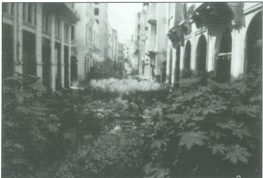
Slika 3: Zelena črta ( Green-line )