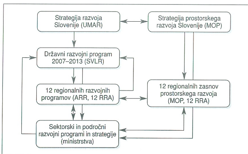
Diagram 1: Povezave postopkov in nosilcev priprave razvojnih dokumentov

Ključnega pomena pri prenosu prostorskih in okoljskih vsebin iz RZPR v RRP sta vzpostavitev in de-