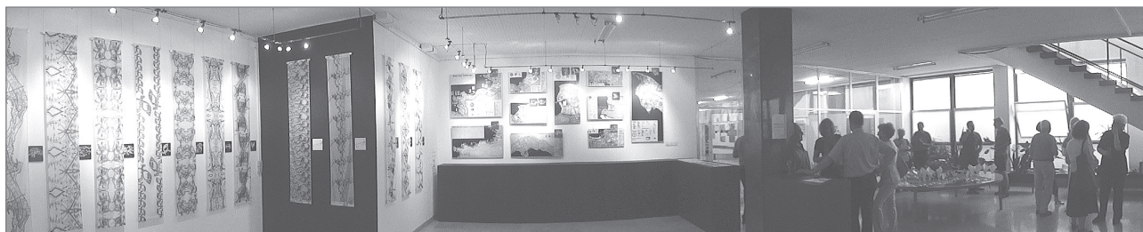
Slika 3: Razstava Urbane podobe v Galeriji Bernardo Bernardi v Zagrebu, 2014