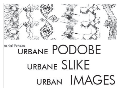
Slika 1: Katalog kolekcije dvanajstih urbanih podob s spremljajočimi zgodbami (urednica in oblikovalka kataloga Jasna Kralj Pavlovec)

Njena dela in zgodbe, ki jim sledijo druga za drugo, nas popeljejo v svet subtilnih prostorskih zaznav, različnih mogočih interpretacij posameznih longitudinalnih zapisov, ki skupaj tvorijo likovno in vsebinsko zaključeno zgodbo.