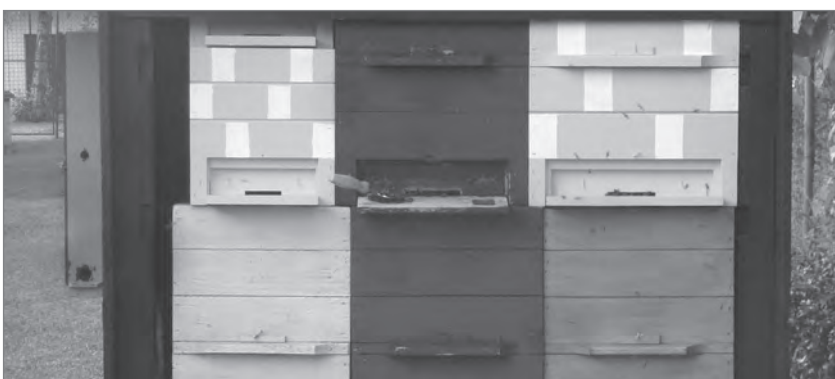
Slika 8: Skupnostni panj v šolskem čebelnjaku