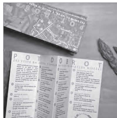
Slika 6: Zloženko Pot dobrot