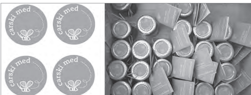
Slika 9: Carski med – (izbrani okusi cvetic soseske Ruski car in ljubljanskega Posavja, (foto/oblikovanje nalepke: Marko Klemen)