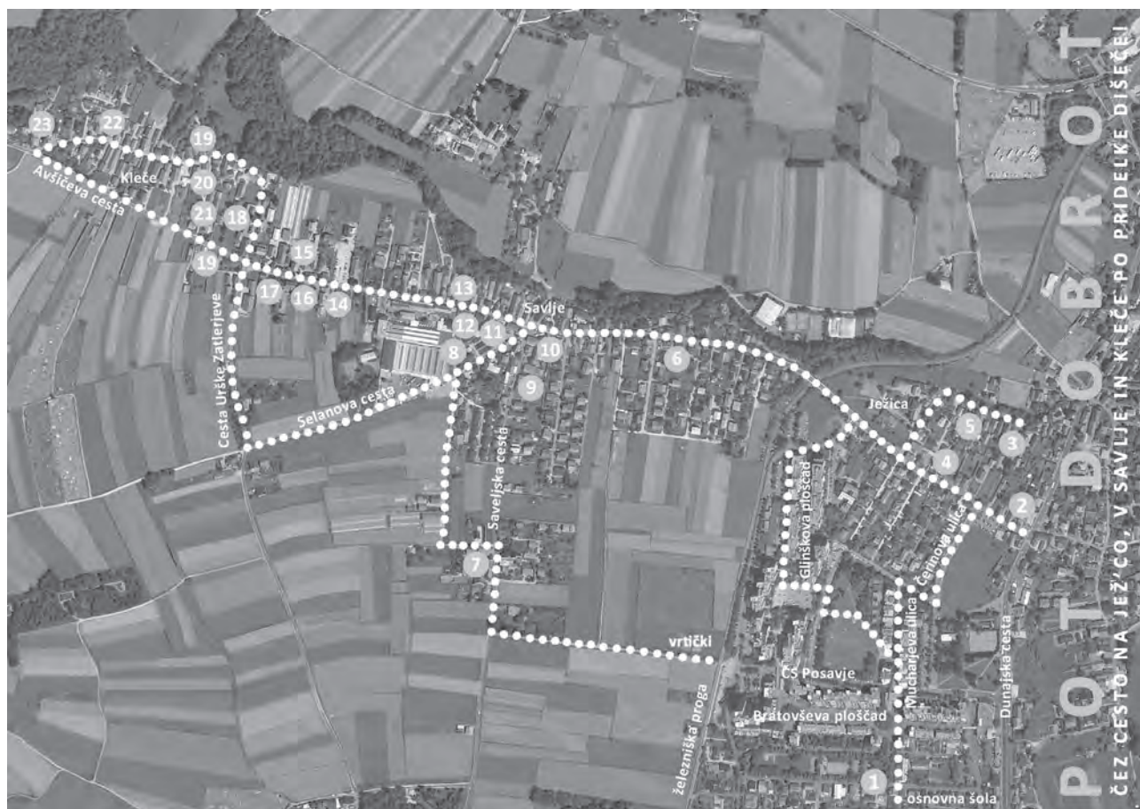
Slika 3: Pot dobrot – sprehajalna pot med solesko Ruski car in pridelovalci v Savljah, Klečah in na Ježici

Ker je pobuda izšla iz lokalnega okolja, smo v načrtovanje vključili prebivalce. Idejo smo prvič predstavili v okviru mednarodnega dogodka Urbani spre-