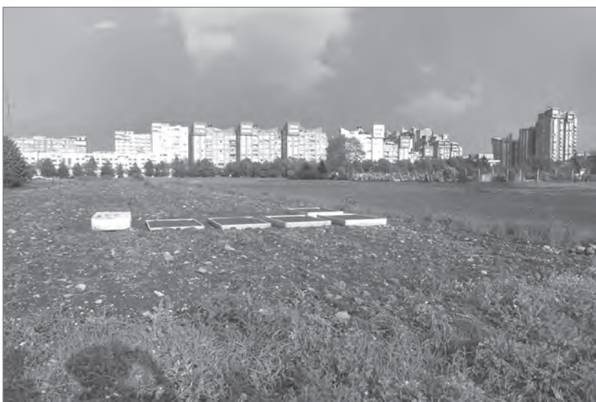
Slika 2: Soseska, zgrajena na poljih in travnikih ljubljanskega Posavja