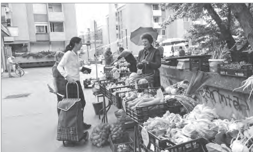
Slika 7: Tržni dan Pot dobrot na Bratovševi ploščadi