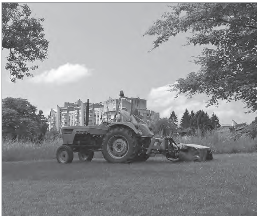
Slika 1: Med mestom in vasjo

Inovativna prostorska zasnova soseske (avtorji V. B. Mušič, M. Bežan, N. Starc) je na rob vaškega prostora vpeljala model urbane ulice, ki naj bi živost mestnega življenja ponesla na ljubljansko podeželje. V soseski so se naselili prebivalci iz različnih delov Slovenije in Jugoslavije. Veliko jih je prišlo s podeželja in so bivanje v stiku z naravo zamenjali za bivanje v utesnjenih betonskih stolpnica. Kljub naprednim prostorskim idejam in naporom načrtovalcev,