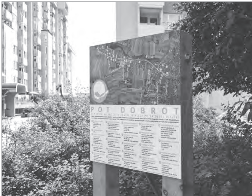
Slika 4: Označevalna tabla Pot dobrot

hod Jane>s Walk, ki promovira pešhojo v vsakdanjem življenju in pri vsakodnevnih opravkih. S sprehodom smo preverili različne mogoče trase poti, udeleženci sprehoda so nas opozorili na predele in ambiente, ki jih je vredno vključiti, opozorili smo na pozitivne učinke pešačenja na zdravje, na intenzivnejše in bolj doživeto spoznavanje prostora z vidika pešča, o dostopnosti in urejenosti obstoječih poti med sosesko in vasi, o skrbi za kulturno krajino, pestrosti lokalnih običajev, domačih imen v vaseh ipd.