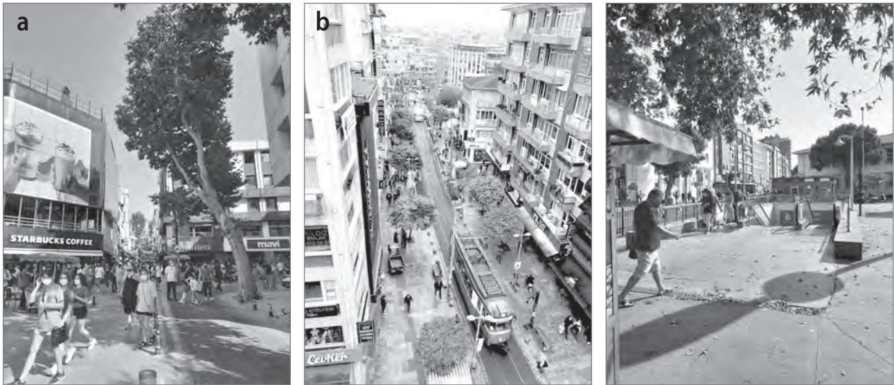
Slika 4: a) Ljudje na nakupovalnem območju (foto: B. Sevin), b) cona za pešce s trgovinami (foto: N. Ç. Erkan), c) postaja podzemne železnice (foto: B. Sevin)