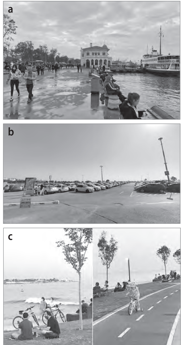
Slika 3: Različna prostorska raba nabrežja v Kadıköy, a) pomoli, b) parkirišče, c) rekreacijsko območje

V glavnem prostorskem načrtu mesta je Kadıköy opredeljen kot kulturno in prometno vozlišče, v zadnjih letih pa je postal še bolj obiskan in bolj kozmopolitski. Zaradi gostinskih lokalov ter raznih prostorov in površin za razvedrilo in zabavo so se okrepile tudi kulturne aktivnosti. Ker je območje dobro