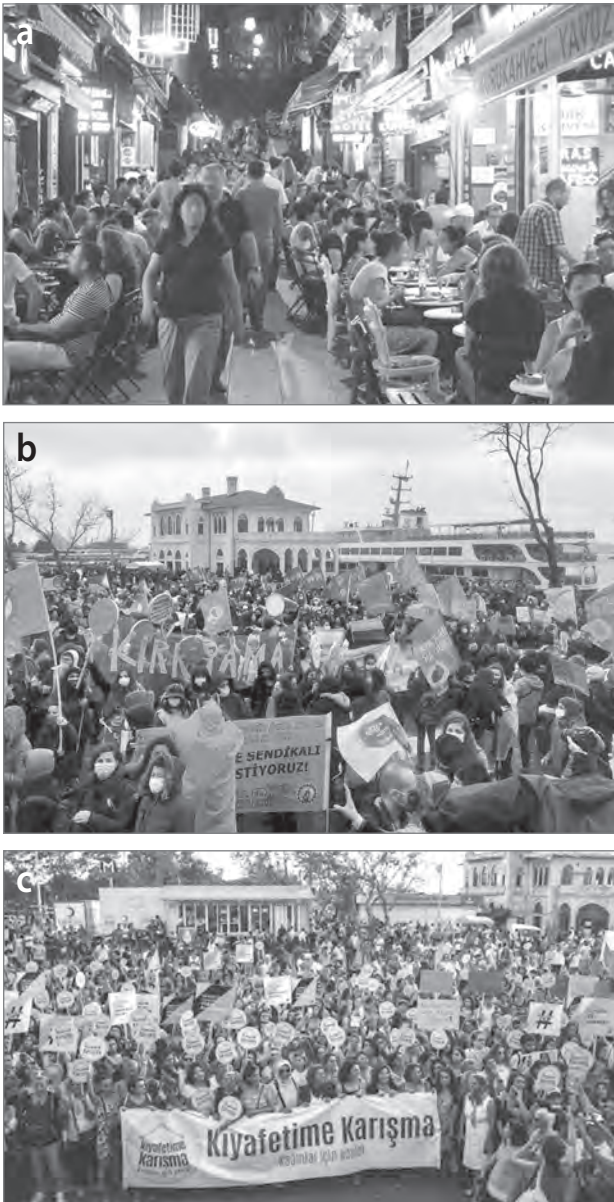
Slika 2: a) nočno življenje, b) praznovanje ob dnevu žensk, c) protest s sloganom: Pustite naša oblačila pri miru v Kadıköy

sledica občutenja strahu pred kriminalom na javnih mestih. Eden izmed razlogov za izvedbo raziskave v Kadıköy je bil tudi protest s sloganom: Pustite naša oblačila pri miru. Zaradi zgoščenosti tako formalnih kot neformalnih družbenih organizacij v Kadıköy se soseska z vidika družbenogospodarskih dejavnikov, kulture in nočnega življenja močno razlikuje od drugih območij v Istanbulu (slika 2).